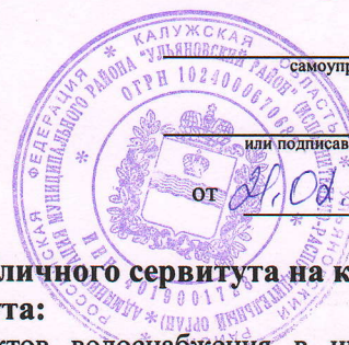
Схема расположения границ публичного сервитута на кадастровом плане территории