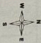
Схема размещения площадок по сбору ТКО д. Вязовна СП "Село Ульяново" Ульяновский район Калужская область